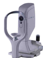
Oculus Park 1

Die Hornhautpachymetrie misst die Dicke der Hornhaut. Hierzu wird entweder ein optisches oder ein Ultraschallgerät verwendet, wobei die optischen Geräte zumeist die genaueren Ergebnisse bringen. Bei einem Ultraschallgerät geschieht die Messung mithilfe einer direkt auf das Auge aufgesetzten Sonde. Bei unserem optischen Gerät erfolgt die Messung unter Zuhilfenahme eines Lasers nach dem Scheimpflug'schen Prinzip.